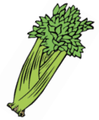
qín cài 芹菜