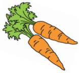
hú luó bo 胡萝卜