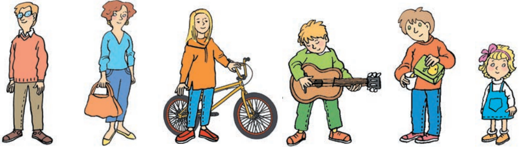
Iwan Marina Tanja Andrej Anton Lisa

3b. Wer ist auf den Bildern? Lest die Fragen und antwortet.