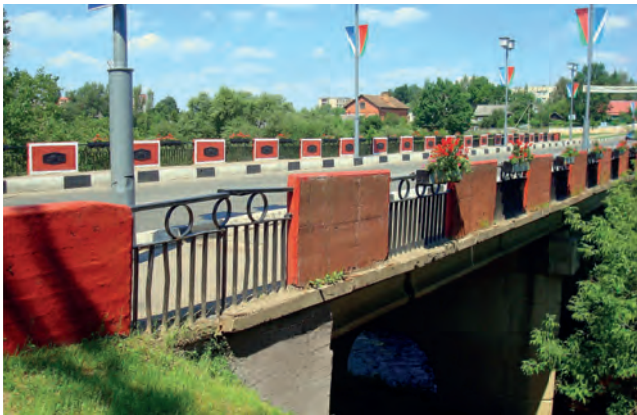
Чырвоны мост цераз раку Палату ў Полацку

Полацк, зрабіць яго роўняй Кіеву і Ноўгараду. Ён запрасіў для будаўніцтва лепшых доўлідаў. На той час гэта было грандыёзнае збудаванне памерам 26 метраў шырынёй і 31 метр даўжынёй.