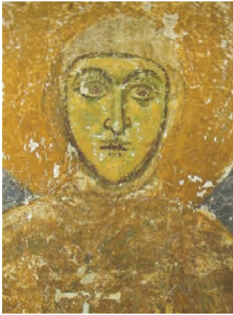
Еўфрасіння Полацкая. Фрэска