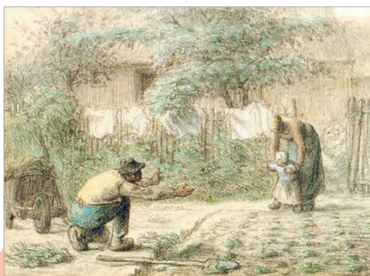
Жан-Франсуа Міле. Першыя крокі

Адной з найважнейшых падзей у жыцці сям'і становіцца нараджэнне дзіцяці. Блізкія людзі віншуюць бацькоў нованароджанага, робяць падарункі. А вось першы крок малога — свята толькі для бацькоў. Малюнак «Першыя крокі» французскага мастака Жана-Франсуа Міле — адна з самых светлых работ майстра.