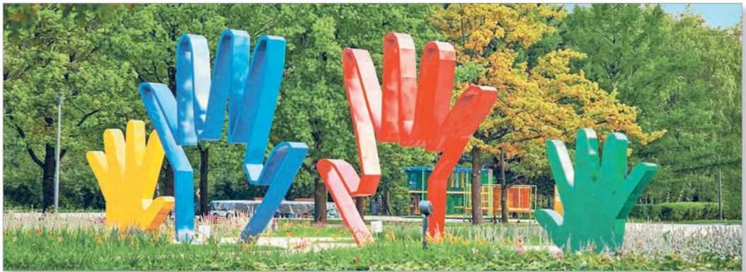
Скульптурная кампазіцыя «Мая сям'я» (Расія)

2. У кожнай сям'і здараюцца вясёлыя гісторыі. Папрасіце дарослых сямейнікаў падзяліцца адной з такіх гісторый. Раскажыце пра яе ў класе.