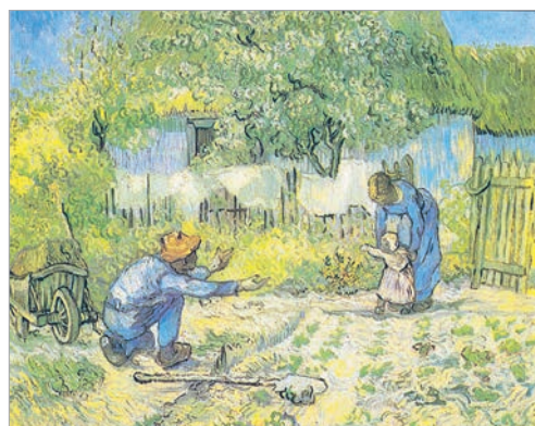
Вінцэнт Ван Гог. Першыя крокі (паводле карціны Міле)