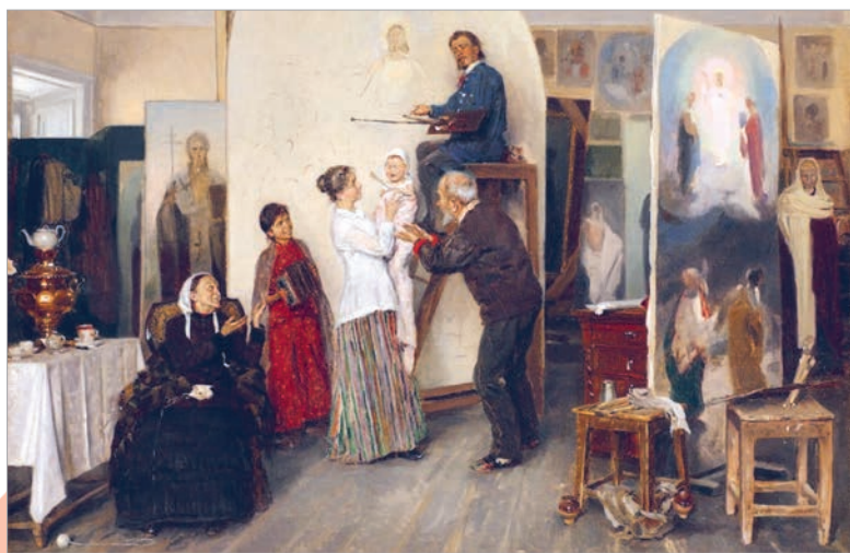
Уладзімір Макоўскі. Дэспат сям'і. У майстэрні мастака

У карціне шмат дэталяў. Яны распавядаюць нам пра зацікаўленні і захапленні ў сям'і. Гэты сямейны партрэт можна доўга разглядаць і нават «слухаць», уяўляючы гукі, якія напаўнялі гэты далёкі цёплы дзень.