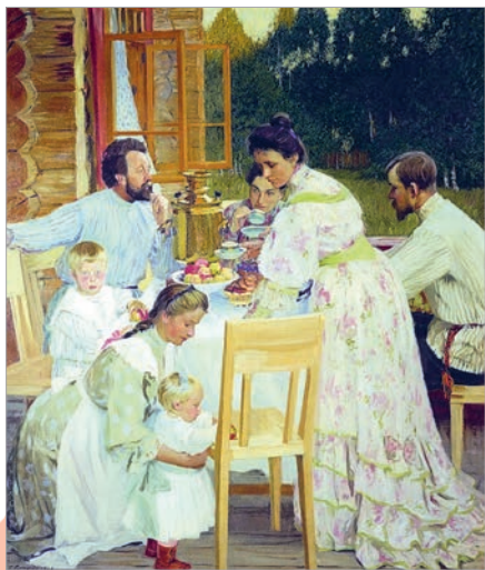
Барыс Кустодзіеў. На тэрасе

«Мая сям'я...» Пры гэтых словах кожны чалавек уяўляе нешта вельмі асабістае, вельмі важнае для яго. У дамашнім асяроддзі людзі адчуваюць сябе спакойна і ўпэўнена. Таму многія мастакі з асаблівым задавальненнем малявалі сябе сярод сямейнікаў, падкрэсліваючы любоў і павагу да блізкіх.