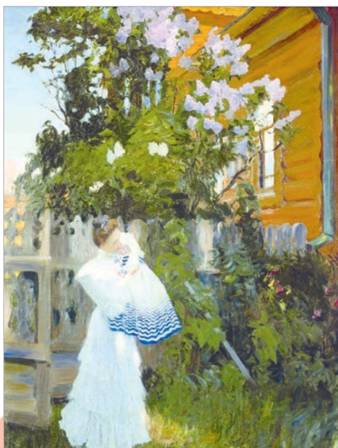
Барыс Кустодзіеў. Бэз