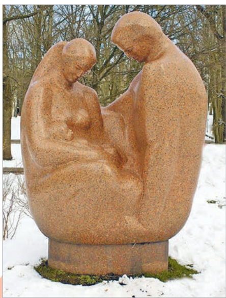
Лявонас Жукліс. Сям'я (Літва)