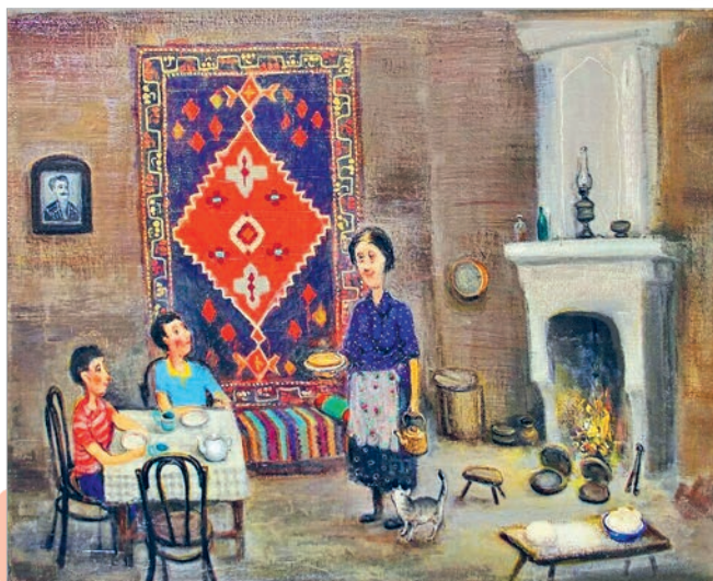
Ладо Тэўдарадзэ. Сям'я

прыродзе, у падарожжы і інш. Пастарайцеся ў фотаздымку адлюстраваць атмасферу вашай сям'і;