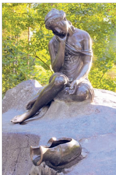
Павел Сакалоў. Малочніца (Расія)

Напрыклад, на карціне мастака Валянціна Сярова — звычайная дзяўчынка. Магчыма, яна падобная да каго-небудзь з вашых знаёмых? Цяпер паназіраем за дзяўчынай, якая сядзіць на гранітнай скале. Пра што яна так кранальна сумуе? Што асаблівага бачаць паэты і мастакі ў скульптуры «Малочніца», створанай рускім скульптарам Паўлам Сакаловым?