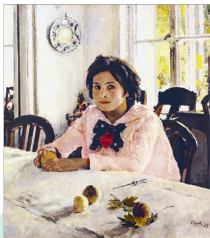
Валянцін Сяроў. Дзяўчынка з персікамі

Цяжка ўявіць чалавека, якога мастацтва пакідае безуважным. Самі таго не заўважаючы, мы дзелімся з сябрамі ўражаннямі ад прагледжанага фільма, пачутай музыкі, убачаных пабудоў.