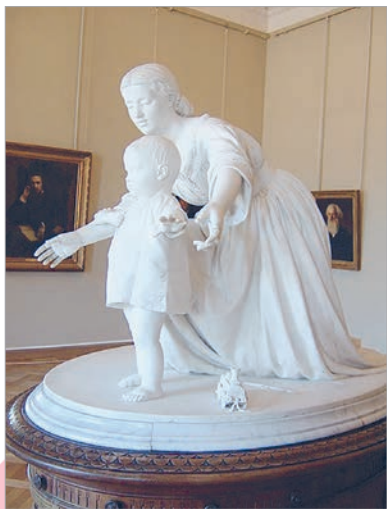
Фёдар Каменскі. Першыя крокі

Клопат маці пра сваё малое — у цэнтры скульптурнай кампазіцыі Фёдара Каменскага. Мастак адлюстраванне хвалюючы момант у жыцці кожнай маці — першыя спробы яе дзіцяці самастойна хадзіць. Скульптар паказаў маці засяроджанай, адухоўленай і шчаслівай. Ледзь улоўная ўсмішка паказвае найвялікшую радасць. Яе разведзеныя ў бакі рукі аберагаюць малое ад магчымых удараў. Балансуючы з боку на бок, дзіця робіць свае першыя няўмелыя крокі.