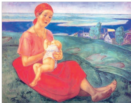
Кузьма Пятроў-Водкін. Маці

яе погляд поўны надзеі. Аднак за знешнім спакоем маці хаваецца ўнутранае напружанне.