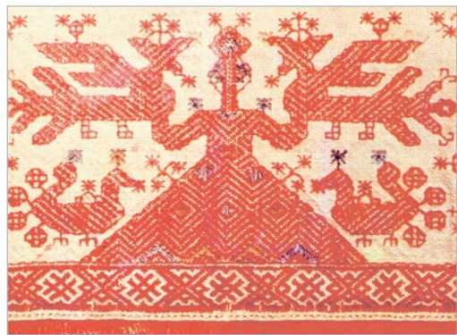
Народная вышыўка з сімвалічнай выявай багіні ўрадлівасці