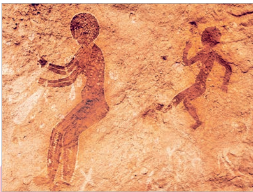
Маці з дзіцём. Фрагмент наскальнага роспісу ў цясніне Тасілін-Аджэр (Алжыр)

Першыя выявы маці з дзіцём з'явіліся ў першабытную эпоху — у наскальным жывапісе. Першабытны чалавек імкнуўся назаўсёды захаваць тое, што лічыў найбольш значным у сваім жыцці.