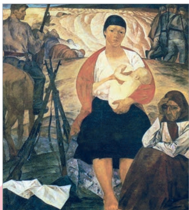
Міхаіл Савіцкі. Партызанская мадонна