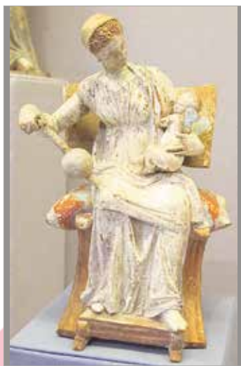
Терракотовая статуэтка «Афродита с Эротом» (Древняя Греция)

В древних славянских культурах почиталась Мать-Земля — богиня плодородия и семейного благополучия, дарующая земле урожай и продолжение рода: «Мать-Земля всех кормит, всех поит, всех одевает, всех своим теплом прогревает» .