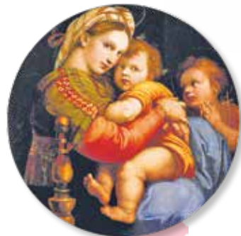
Рафаэль. Мадонна в кресле