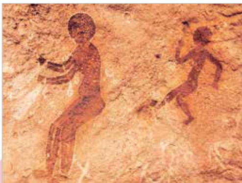
Мать с ребёнком. Фрагмент наскальной росписи в ущелье Тассилин-Аджёр (Алжир)

Первые изображения матери с ребёнком появились в первобытную эпоху — в наскальной живописи. Первобытный человек стремился навсегда запечатлеть то, что считал наиболее значимым в своей жизни.