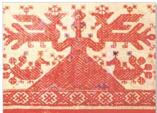
Народная вышивка с символическим изображением богини плодородия