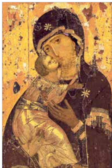
Владимирская икона Божией Матери

Мать, оплакивающая своего сына, — основная тема и в кантате «Stabat Mater» итальянского композитора Джованни Баттисты Перголэзи. Удивительно искренняя и простая мелодия наполнена