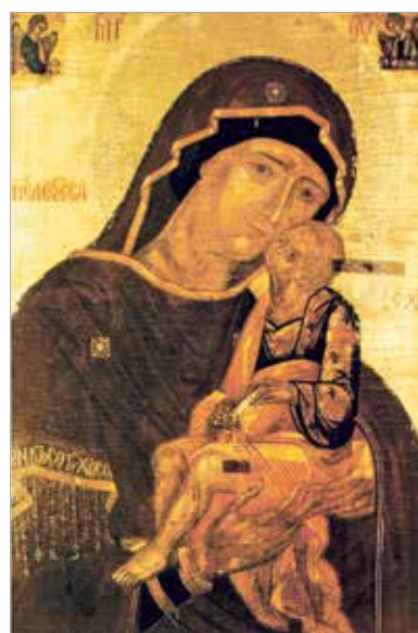
Богоматерь Умиление (г. Малорита, Беларусь)

Икона — священное изображение религиозных сюжетов и образов.