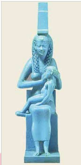
Фаянсовая статуэтка «Богиня Исида с младенцем Гором» (Древний Египет)