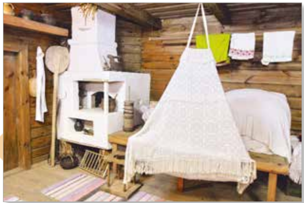
Белорусская хата. Экспозиция Мотольского музея народного творчества (д. Мотоль, Беларусь)

Рушники в быту белорусов играли важную роль. Ткали их разными способами. От выбранного способа зависел рисунок. Самыми