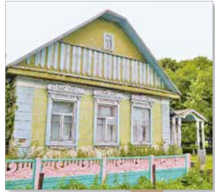
Жилой дом (д. Городец, Беларусь)

Наиболее почитаемым местом в хате был так называемый красный угол, который обустраивали в дальнем углу, по диагонали от печи. Здесь висели иконы, обрамлённые рушниками. В красном углу стоял стол, устланный скатертью. Хлеб, который обычно оставляли на столе, также накрывали рушником.