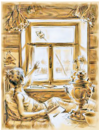
Ил. Н. Н. Королёва

— Мама! — закричал Павлуня и заметался по кровати. Павлуня не помнил, как он очутился на полу. Еле переставляя ноги, он начал искать что-нибудь обуть. Как назло, ничего не было. Наконец он отыскал за печкой старые отцовские катанки 1 , надел их, надел материн казачок 2 , а шапка ещё с осени висела на гвоздике около часов.