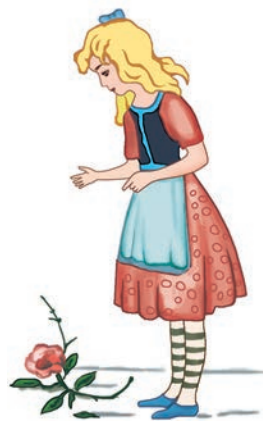
Ил. В. С. Алфеевского

С того дня всякий раз, как девочка приносила ему книжку с картинками, он говорил, что эти картинки хороши только для грудных ребят; всякий раз, как бабушка что-нибудь рассказывала, он придирался к каждому слову; а потом... дошёл и до того, что стал её передразнивать: наденет очки и крадёт за нею, подражая её походке и голосу. Выходило очень похоже, и люди смеялись. Вскоре маль-