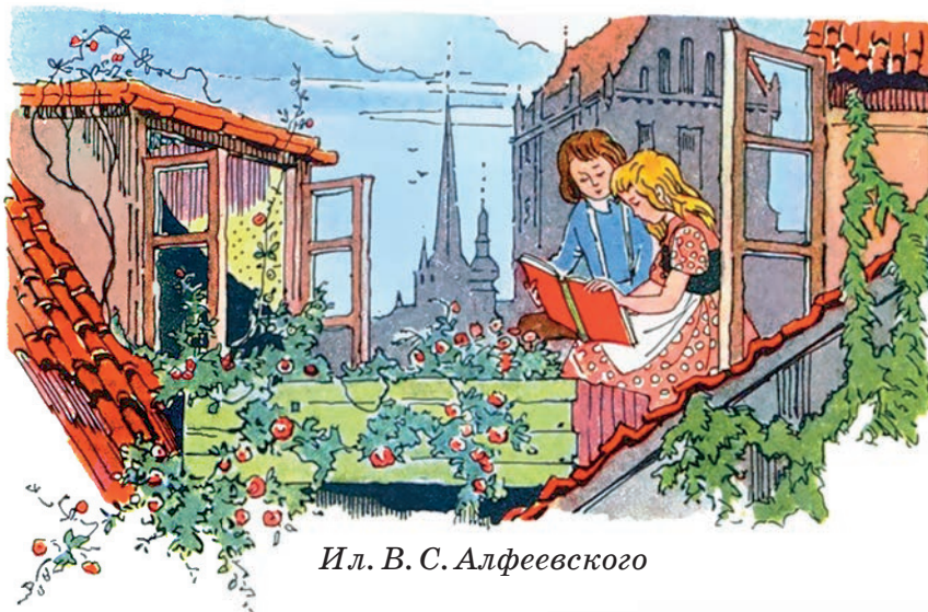
Ил. В. С. Алфеевского

Кай и Герда сидели и рассматривали книжку с картинками — зверями и птицами. На больших башенных часах пробило пять.