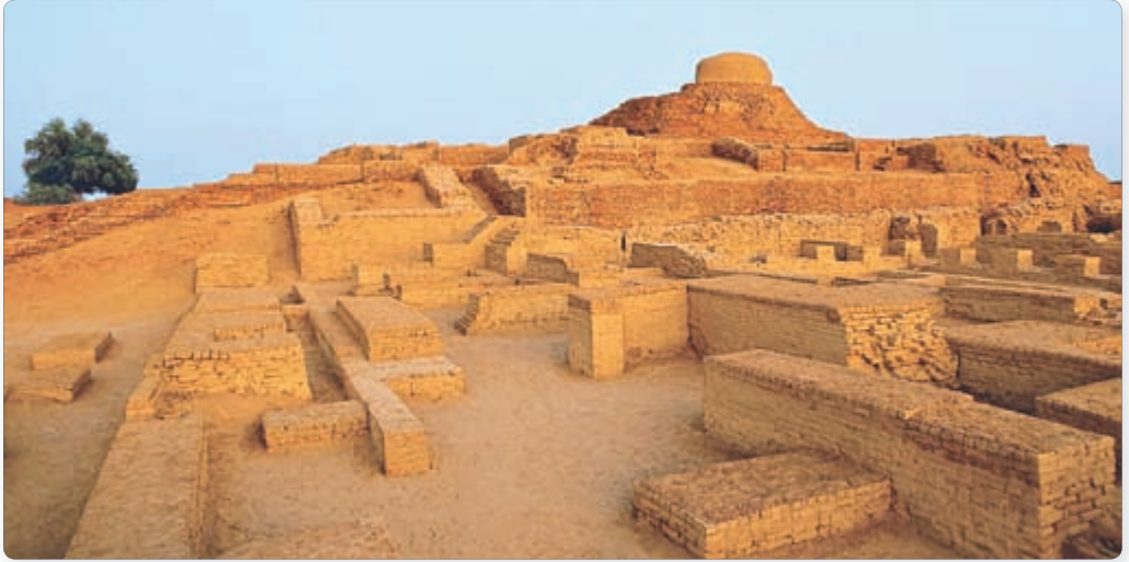
▲ Руіны Махенджа-Дара

Гэта была вялікая і густанаселеная дзяржава. Жыхары краіны падзяляліся на багатых і бедных. Лічыцца, што на чале гэтай дзяржавы стаялі жрацы. Высокага ўзроўню дасягнуў марскі і сухапутны гандаль. У трэцім тысячагоддзі да н. э. найбольш актыўна індцы гандлявалі з Міжрэччам. Туды з Індыі везлі пышныя індыйскія баваўняныя тканіны, ювелірныя вырабы. Індыйскія вырабы траплялі нават у далёкі Егіпет. Па сушы вёўся актыўны гандаль з суседнімі качавымі народамі. Па невядомых прычынах індская цывілізацыя паступова загасла, гарады былі закінуты, людзі перасяліліся ў даліну ракі Ганг.