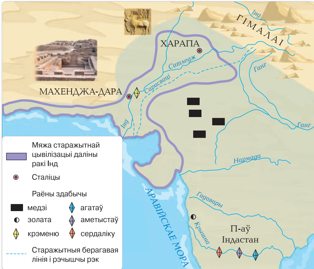
▲ Карта Старажытнай Інды

У час раскопак Махенджа-Дара вучоныя ўбачылі горад з шырокімі прамымі вуліцамі. У цэнтры знаходзілася крэпасць. Дамы з абпаленай цэглы мелі водаправод і каналізацыю. У жыллі знойдзены дзіцячыя цацкі, гіры для шалей, пячаткі з надпісамі, залатыя і сярэбраныя ўпрыгажэнні, прылады працы і зброя з медзі і бронзы.