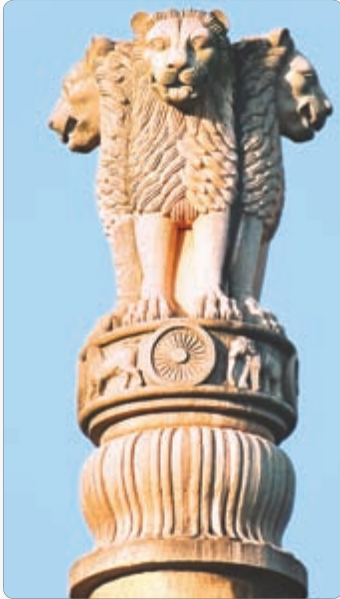
▲ Верхняя часть колонны Ашоки