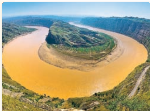
▲ Хуанхэ. Сучасны выгляд

разлілася. Усё гэта знайшло адлюстраванне ў міфах пра велізарных драконаў, што жывуць у рацэ.