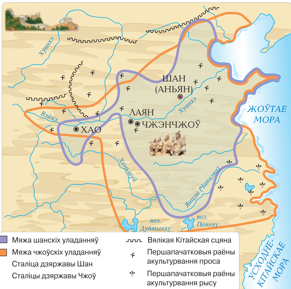
▲ Карта Старажытнага Кітая

Апішыце месцазнаходжанне Кітая і яго галоўных рэк.