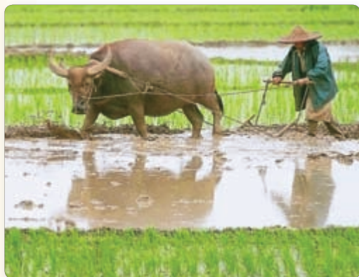
▲ Работы на рысавым полі ў сучасным Кітаі

2. Заняткі старажытных кітайцаў. Як і ў іншых цывілізацыях Старажытнага Усходу, асновай гаспадаркі старажытных кітайцаў стала земляробства. Першыя земляробы аселі ў сярэднім цячэнні Хуанхэ. Затым прыступілі да асваення басейна ракі Янцзы. Яны апрацоўвалі лёсавую глебу матыкамі. Сеялі проса і пшаніцу, вырошчвалі агародніну, разводзілі жывёл. Прылады працы і зброю рабілі з бронзы.