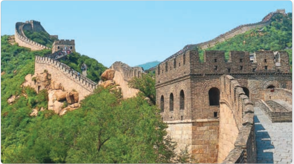
▲ Вялікая Кітайская сцяна. Сучасны выгляд

ўладу. У выніку гэтай барацьбы перамагла дзяржава Цынь і аб'яднала ўвесь Кітай. Яго правіцель прыняў у 221 г. да н. э. тытул Цынь Шыхуандзі , стаўшы першым імператарам дынастыі Цынь . Па ўсёй краіне былі выдадзены адзіныя законы, уведзена агульная манета. Нават пісьменнасць была зменена такім чынам, каб яе разумелі ва ўсіх канцах Кітая.