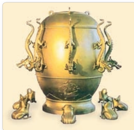
▲ Прыбор для вызначэння землетрасенняў