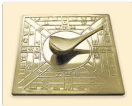
▲ Старажытнакітайскі кампас

Веды кітайскіх купцоў, якія пабылі шмат у якіх краінах, з'яўляліся асновай першых геаграфічных сачыненняў. Для працяглых падарожжаў па морах і пустынях кітайцы вынайшлі компас . У горных раёнах часта адбываліся землетрасенні. Каб хутчэй даведацца пра іх, у Старажытным Кітаі быў вынайздзены прыбор для вызначэння ваганняў зямной паверхні. Кітайцы вядомыя таксама тым, што вынайшлі порох і арбалет — баявую зброю.