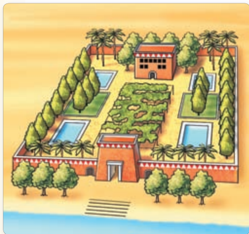
▲ Дом знатнага егіпцяніна. Рэканструкцыя

Простыя егіпцяне жылі ў невялікіх глінабітных хатках, у якіх не было амаль ніякай мэблі. На земляной падлозе — папірусная цыноўка, каля ачага — гліняны посуд. Дах хаты часта выкарыстоўвалі для начлегу.