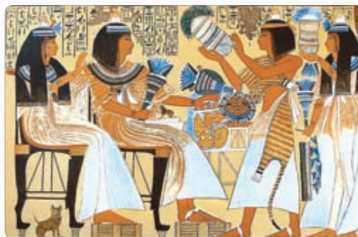
▲ Знатная сям'я. Роспіс грабніцы

4. Егіпецкая сям'я. Сям'я ў Старажытным Егіпце высока цанілася. Жанчыны карысталіся павагай, мелі права валодаць маёмасцю. Егіпцяне вельмі любілі сваіх дзяцей. Амаль да трох гадоў дзіця не расставалася з маці. Дзяўчынкі вучыліся дома. Хлопчыкі імкнуліся авалодаць прафесіяй свайго бацькі, наведвалі школу. Адукаваны юнак нават з простаю сям'ю мог прасунуцца па дзяржаўнай службе. Непаслушэнства асуджалася і ў сям'ю, і ў грамадстве. «Бог любіць паслухмянага, непаслухмянага бог ненавідзіць», — гаворыцца ў егіпецкім павучанні.