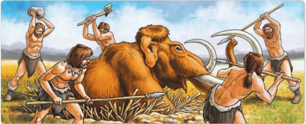
▲ Загоннае паляванне

Складзіце апавяданне паводле малюнка. Што адбывалася да палявання і пасля яго?