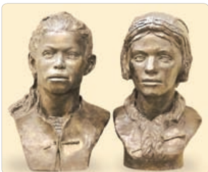
▲ Рэканструкцыя знешняга выгляду дзяўчынкі і хлопчыка краманьёнцаў

Выхаванне дзяцей у родавай абшчыне было суровым. Дзеці павінны былі ведаць звычаі роду і дапамагаць дарослым. Калі хлопчыкі падрасталі, яны праходзілі праз спецыяльныя выпрабаванні. Самым складаным і цяжкім было маўчаць пад градам удараў або правесці аднаму некалькі дзён і начэй у глухім лесе. І толькі той, хто вытрымліваў гэтыя выпрабаванні, становіўся раўнапраўным мужчынам роду.