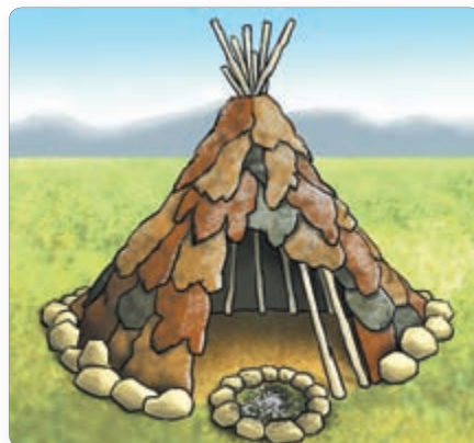
▲ Рэканструкцыя жылля краманьёнцаў

У кожным родзе налічвалася па некалькі дзясяткаў чалавек. Агульнымі ў іх былі жыллё, запасы ежы і хатні ачаг. Абшчына кіравалася адным з членаў роду — правадыром (старэйшынам) . Гэта быў самы вопытны і паважаны родзіч, які добра ведаў звычкі жывёл, уласцівасці раслін і правілы паводзін, што дапамагалі выжыць у тых умовах. Старэйшына сачыў за справядлівым размеркаваннем прадуктаў, адзення і месцаў у жыллі.