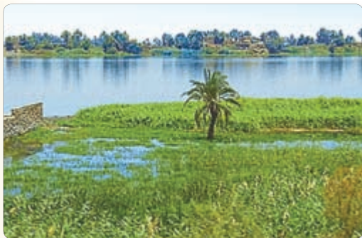
◀ Разліў Ніла