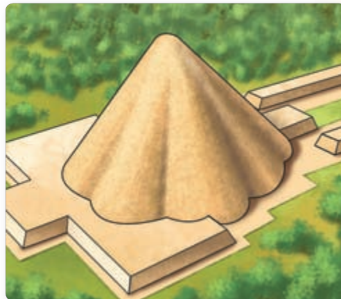
▲ Вялікая піраміда Ла-Венты

2. Ла-Вента — горад альмекаў. Ла-Вента займала даволі вялікую плошчу. Галоўным збудаваннем горада з'яўлялася вялікая ўсечаная піраміда 30-метровай вышыні, зробленая з утрамбанай зямлі. Піраміда выкарыстоўвалася ў рэлігійных мэтах. Каля яе падножжа стаялі