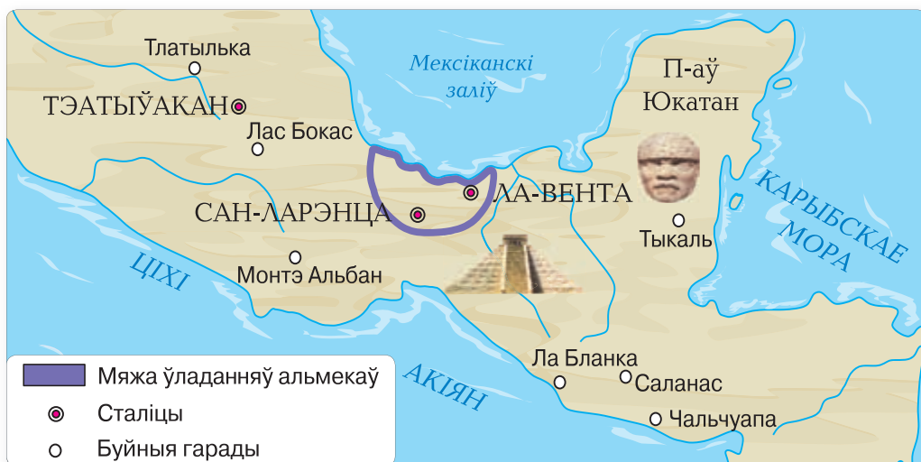
▲ Карта Старажытнай Амерыкі

Некаторыя вучоныя называюць іх «бацькамі амерыканскай гісторыі». Іерагліфічнае пісьмо, арыгінальная сістэма лічбаў, каляндар, водаправодныя сістэмы, збор какававых зярнят і каўчуку (соку дрэў для вырабу непрамакальнага абутку). Якія яшчэ дасягненні цывілізацыі альмекаў сталі асновай культуры старажытных народаў Амерыкі?