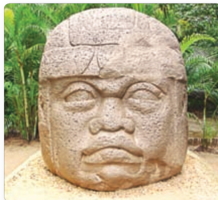
▲ Каменная галава

✓ Маса вырабаў ад 6 да 40 тон, вышыня — да 2,5 метра.