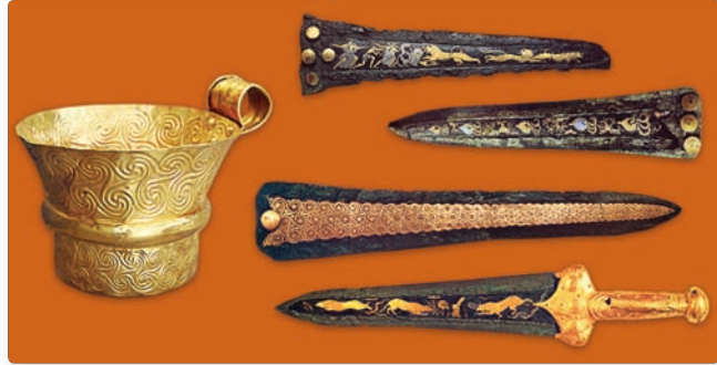
▲ Вырабы з Мікен:

залатая пахавальная маска, чаша і інкруставаныя золатам кінжалы