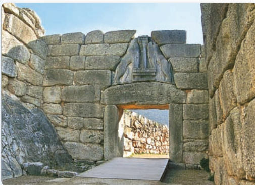
◀ Ільвіныя вароты ў Мікенах

5. Дарыйскае заваяванне. Мікенская цывілізацыя была моцна аслаблена Траянскай вайной. У гэты час з поўначы Балканскага паўвострава на поўдзень, у Грэцыю, накіраваліся плямёны грэкаў-дарыйцаў. Яны не валодалі культурай і навыкамі ахейцаў, але былі ўзброены жалезнымі, а не бронзавымі мячамі. Новыя заваёўнікі захапілі і разбурылі амаль усе палацы. Было забыта пісьмен-