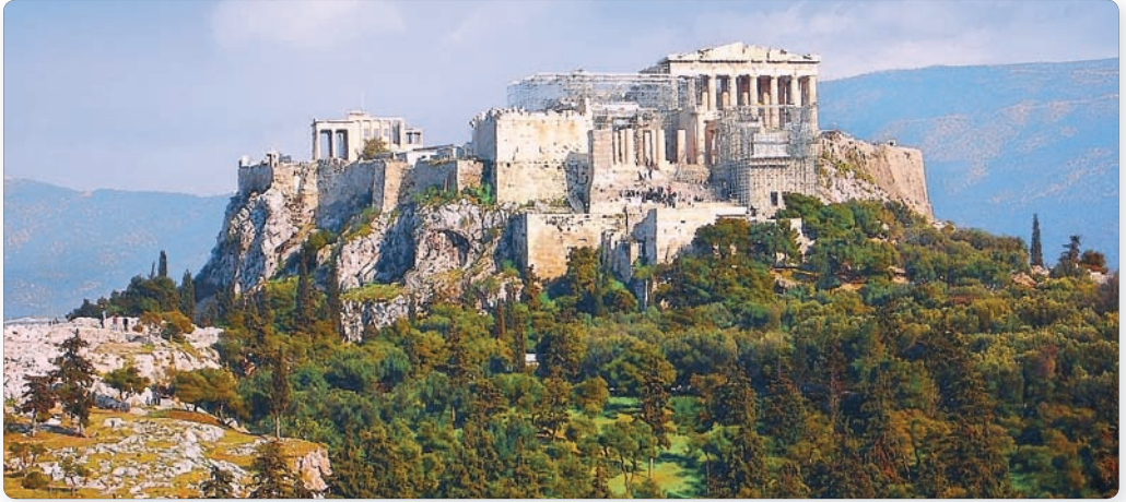
▲ Афінські Акропаль. Сучасны выгляд

Горад, названы ў гонар багіні Афіны, з'яўляецца адным з найстаражытнейшых гарадоў Еўропы. Ён размешчаны на высокім узгорку за 6 км ад мора. У VIII ст. да н. э. Афіны ператварыліся ў цэнтр самастойнай дзяржавы — поліса. На вуліцах горада з'явілася шмат лавак і рамесных майстэрняў. У іх працавалі ганчары і шаўцы, кавалі і муляры.