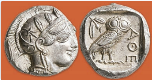
▲ Афінская манета

На агары па рыначных днях ішоў бойкі гандаль. З усіх канцоў Атыкі сюды з'язджаліся сотні людзей. Афіняне куплялі прадукты харчавання, а земляробы — рамесныя вырабы.