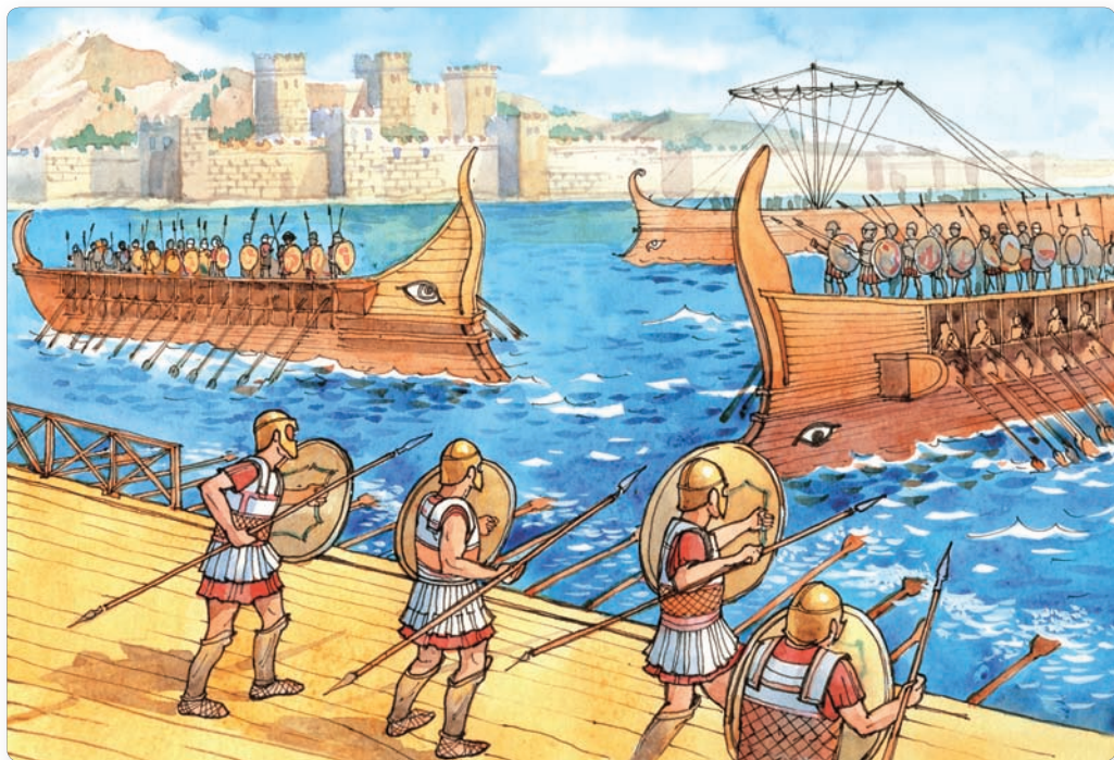
▲ Атака на Сіракузы. Сучасны малюнак

Афіны, выкарыстоўваючы флот, спусташалі ўзбярэжжа Пелапанэса. Абодва бакі неслі вялікія страты, і ў выніку быў заключаны мір, які працягнуўся ўсяго шэсць гадоў. У 415 г. да н. э. афіняне вырашылі захапіць самую буйную калонію ў Міжземным моры — Сіракузы на востраве Сіцылія. Паход скончыўся няўдачай. Большая частка афінскага флоту была страчана. Многія воіны трапілі ў палон і былі прададзены ў рабства.