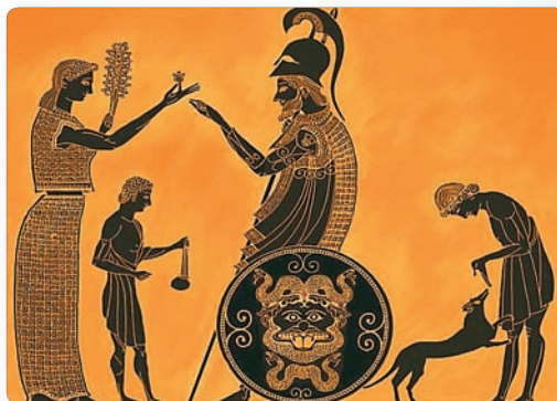
▲ Грэчаская сям'я. Малюнак на вазе

У бітве пры Платэях грэкі разграмілі персідскую армію. Яны захапілі багаты шацёр правадыра персаў. Кіраўнік грэчаскага войска, убачыўшы ежу персідскага палкаводца, засмяўся і сказаў: «Эліны, я запрасіў вас для таго, каб даказаць вам неразумнасць персаў. У іх такі багаты стол, а яны прыйшлі адабраць у нас нашу бедную ежу».