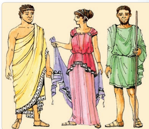
▲ Адзенне старажытных грэкаў. Рэканструкцыя