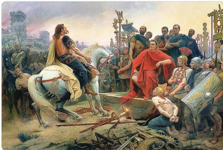
▲ Здача ў палон Цэзару гальскага правадыра. Мастак Л. Роер

1. Грамадзянскія войны. У канцы II ст. да н. э. у Рыме ўзмацніліся супярэчнасці паміж сенатарскай арыстакратыяй і часткай багатых рымлян. Апошнія былі незадаволены тым, што ўсе вышэйшыя пасады ў рэспубліцы знаходзіліся ў руках сенатараў-арыстакратаў. Іх падтрымлівалі італійскія саюзнікі