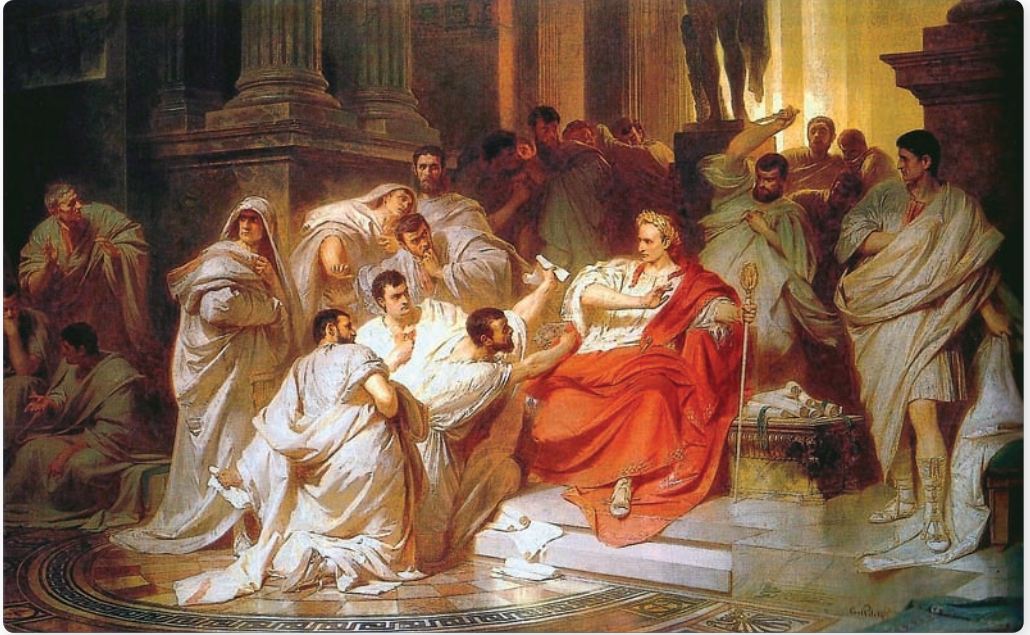
▲ Забойства Цэзара. Мастак К. Пілоці