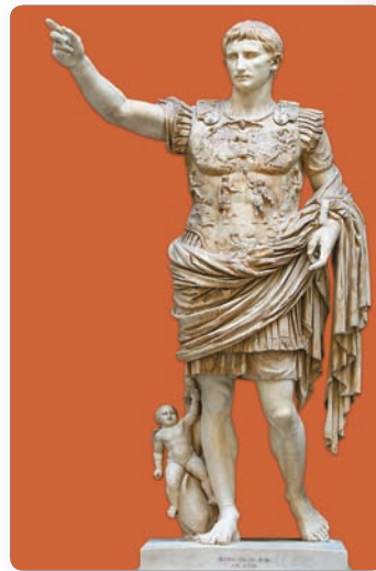
▲ Актавіян Аўгуст

3. Імператар Актавіян Аўгуст. У 27 г. да н. э. сенат абвясціў Актавіяна кіраўніком Рымскай дзяржавы. З гэтага часу ён стаў называцца імператар Цэзар Аўгуст. «Імператар» у той час азначала «палкаводзец», «военачальнік». Слова «Цэзар» сведчыла пра роднасныя сувязі з Юліем Цэзарам. А імя Аўгуст, гэта значыць «свяшчэнны», даў яму сенат.