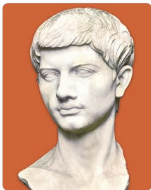
▲ Бюст Вергілія

Паэты Гарыцый і Авідзій лічылі, што важная задача паэзіі — праз пачуцці навучаць людзей. Знакамітай стала фраза Авідзія: «Вучыцца трэба заўсёды, нават у ворага».