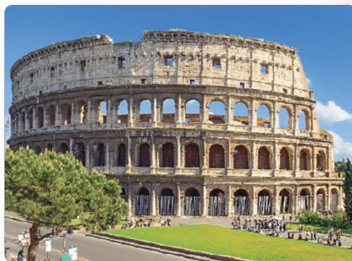
▶ Калізей. Сучасны стан