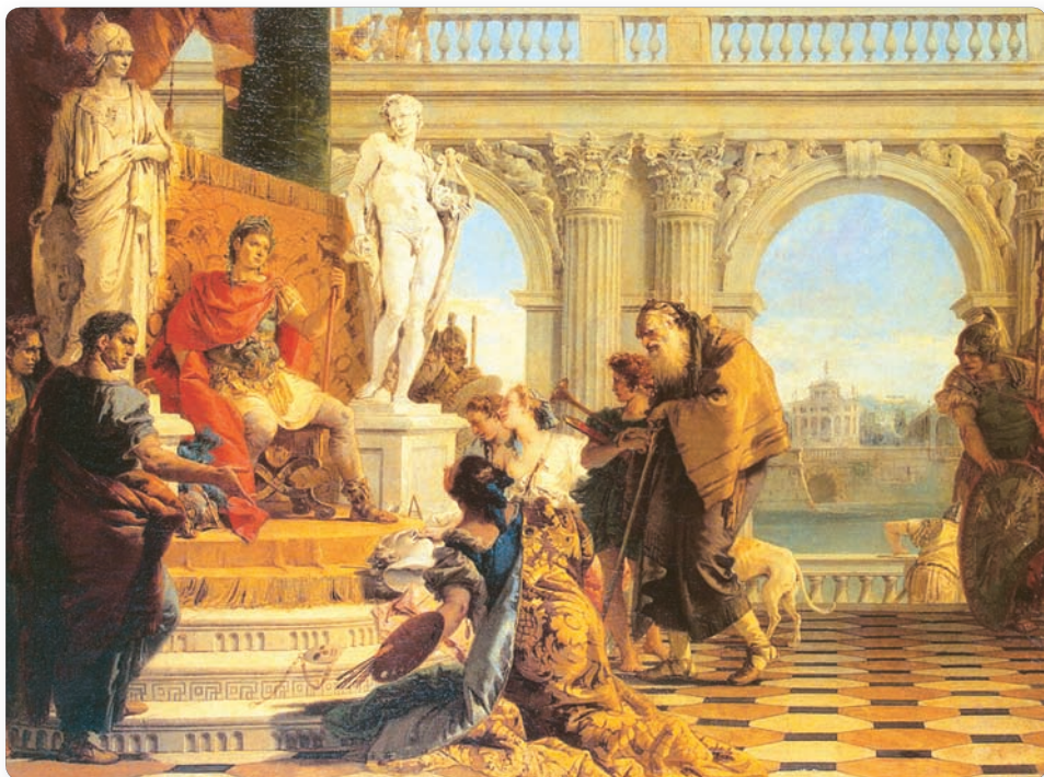
▲ Мецэнат прадстаўляе імператару Аўгусту вольныя мастацтвы. Мастак Д. Б. Цьепала, XVIII ст.

Творчасці паэтаў спрыяў багаты і ўплывовы сябар імператара Актавіяна — Гай Мецэнат . Ён запрашаў паэтаў да сябе дадому для чытання вершаў. Заўсёды дапамагаў паэтам. За гэта яны павінны былі праслаўляць імператара і яго кіраванне. Неацэнная дапамога Мецэната зрабіла яго імя хадзячай назвай. Цяпер мы называем мецэнатам чалавека, які бескарысліва падтрымлівае мастацтва.