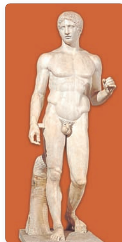
▲ Копьеносец, Поликлет

☑ Каким образом скульпторы подчеркнули красоту и величие богов и человека?