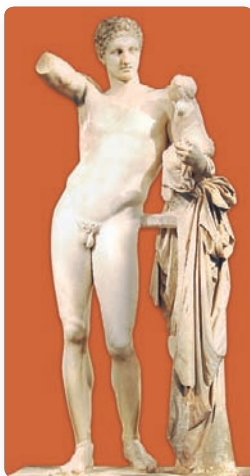
▲ Гермес, Пракситель