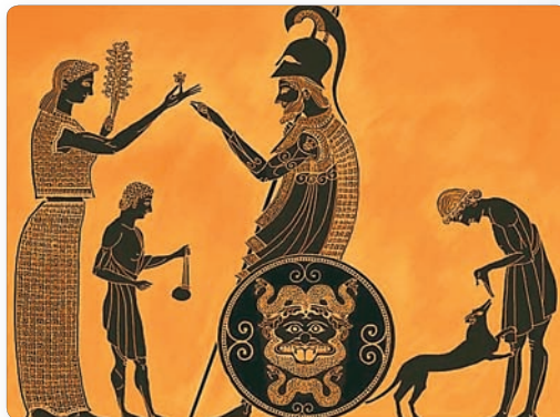
▲ Греческая семья. Рисунок на вазе

В битве при Платеях греки захватили богатый шатер предводителя персов. Глава греческого войска, увидев пищу персидского полководца, засмеялся и сказал: «Эллины, я пригласил вас для того, чтобы доказать вам глупость персов. У них такой богатый стол, а они пришли отнять у нас нашу бедную пищу».