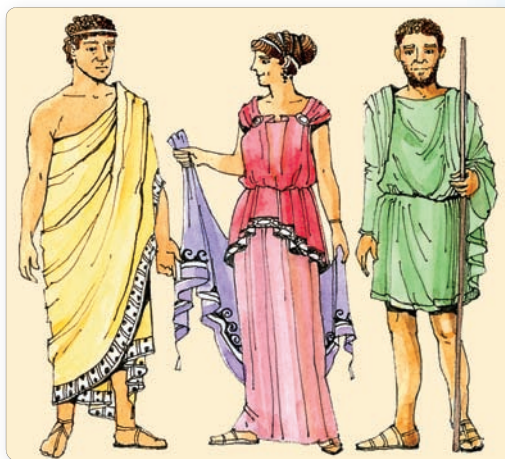
▲ Одежда древних греков. Реконструкция