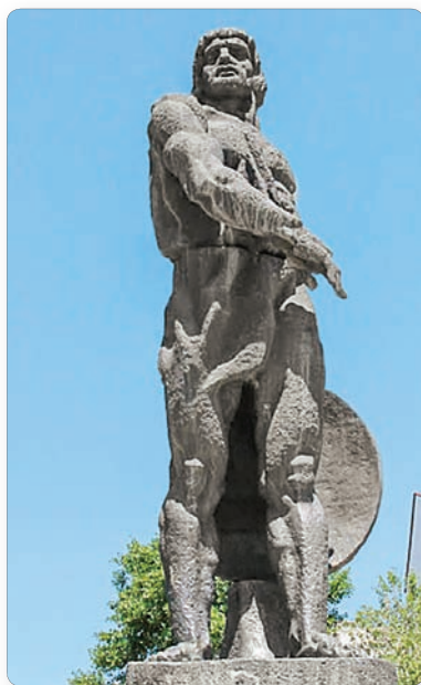
▲ Памятник Спартаку на его родине

Красс завязал сражение, самое большое из бывших в эту войну. В нем пало 12 300 рабов. Спартак после поражения начал отступать. Затем он устремился на самого Красса, но из-за сражающихся и раненых ему не удалось добраться до римского полководца. Свита Спартака бежала, а он, окруженный врагами и мужественно отражая их удары, в конце концов был убит.