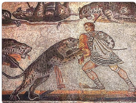
▲ Бои гладиаторов. Мозаика ▶