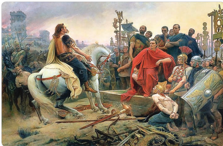
▲ Сдача в плен Цезарю галльского вождя. Художник Л. Ройер

1. Гражданские войны. В конце II в. до н. э. в Риме усилились противоречия между сенаторской аристократией и частью богатых римлян. Последние были недовольны тем, что все высшие должности в республике находились в руках сенаторов-аристократов. Их поддерживали италийские союз-