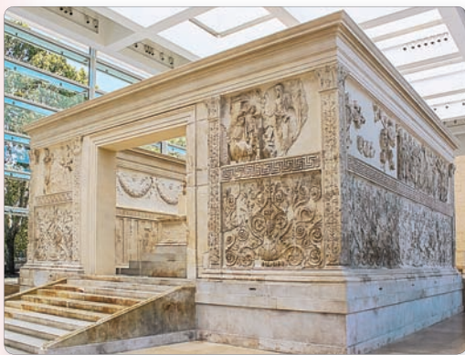
◀ Алтарь Мира в честь римской богини мира. Реконструкция

Но даже всемогущие императоры нуждались в поддержке народа. Они всячески старались укрепить свой авторитет. Для