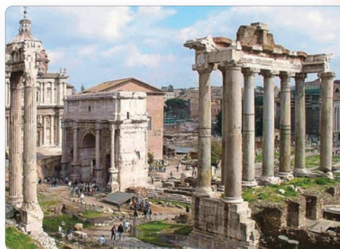
▲ Римский форум в наши дни