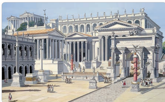
▲ Римский форум. Реконструкция