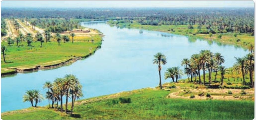
▲ Река Евфрат. Современный вид

Воды рек обильно орошали поля и делали их плодородными. Уже в феврале здесь начинали зеленеть луга. Плодородная земля речных долин давала большие урожаи и была основным богатством в Междуречье. Нередко за год удавалось собирать не один, а два урожая.