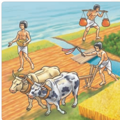
▲ Оросительные сооружения. Современный рисунок

нелегко было осваивать новые земли. На берегах рек пришлось вырубать кустарники, строить каналы и дамбы. Чтобы лучше использовать воду, местные жители сооружали водохранилища и оросительные каналы. В них вода надолго задерживалась после разливов, и ее можно было использовать для орошения полей. Кроме того, водохранилища и дамбы защищали посевы и поселения от наводнений.