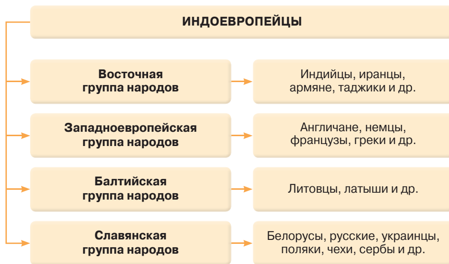
▶ Некоторые индоевропейские народы

Они покорили местное население и основали несколько государств, которые в XVII в. до н. э. объединились в единое Хеттское царство .