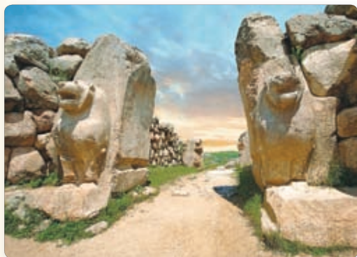
◀ Львиные ворота. Столица Хеттского царства Хаттуса

Широко известны были боги и богини плодородия. Почитали хетты и священных животных и птиц: быка, льва, орла. Священного орла хетты изображали двуглавым.