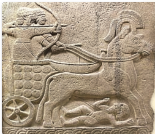
Боевая колесница хеттов. Рельеф ▶

водством — разводили коз и овец. Со временем приручили лошадей и научились использовать их для передвижения колесных повозок.