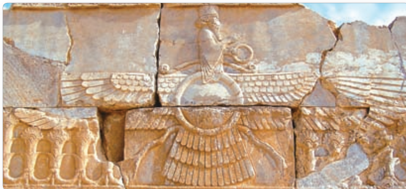
▲ Верховный бог зороастризма. Рельеф

войско его помощников противостояли силам зла и тьмы. Человек должен поддерживать в этой борьбе бога света.