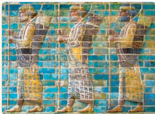
◀ Персидские воины из войска царя. Изображение на стене дворца

выделились племенные союзы мидян и персов. Задолго до прихода ариев здесь уже было государство Элам . Его правители часто воевали с царями Месопотамии. В VII в. до н. э. возникает государство Мидия . Оно просуществовало недолго и в середине VI в. до н. э. было захвачено персами.