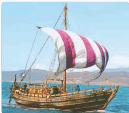
▲ Финикийский корабль. Реконструкция