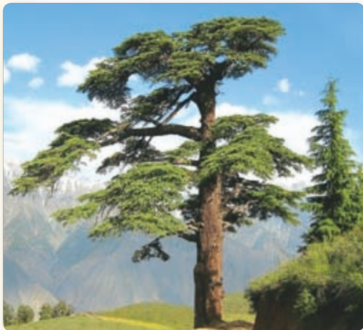
▲ Ливанский кедр

С запада ее омывали теплые воды Средиземного моря. Влажные ветры приносили дожди, и почва не нуждалась в искусственном орошении. Земля Финикии была плодородной. Но ее не хватало, чтобы прокормить всех людей.