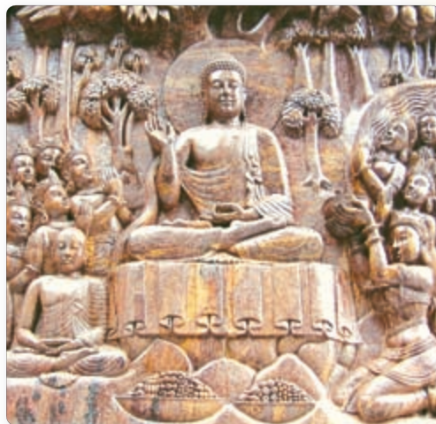
▲ Изображение Будды