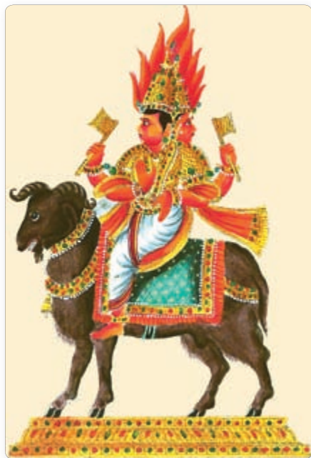
▲ Агни — ведийский бог огня

Сторонников буддизма и индуизма объединяла общая вера в то, что после смерти человек рождается снова. При рождении он получает то, что заслужил своим поведением в прошлой жизни.