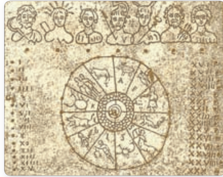
▲ Древнеримский календарь

☑ Как вы думаете, какой счет лет был удобнее — египтян или римлян? Почему?