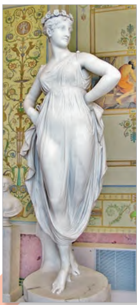
Антонио Канова. Танцовщица