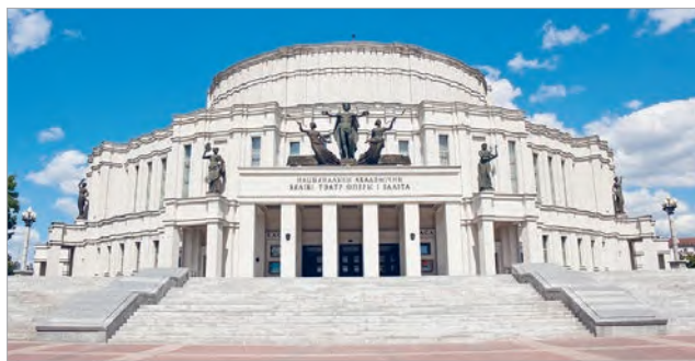
Йосиф Лангбáрд. Национальный академический Большой театр оперы и балета (г. Минск)

Триумф звуков ощущается в художественном образе здания Национального академического Большого театра оперы и балета Республики Беларусь. Динамичные формы сооружения отражают ритм и полётность мелодии архитектурного образа. В окружающей тишине слышится звук фанфар, под которые выходят на сцену артисты театра. Скульптуры, установленные на фасадах, дополняют художественный образ здания театра музыкальной символикой. Над входом возвышается скульптурная группа во главе с покровителем искусства Аполлоном, который держит в руках венки. По обе стороны от него — трубящие музы, прославляющие искусство. Объединяет композицию выполненная в бронзе развевающаяся лента с нотным станом.