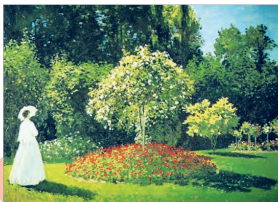
Клод Моне. Дама в саду Сент-Адресс

Диалог — разговор, обмен высказываниями и мыслями.