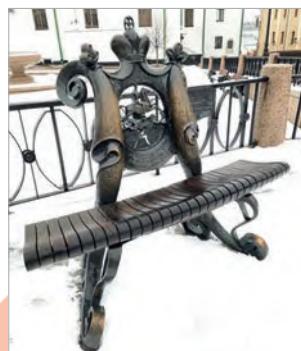
Вадим Мацкевич. Музыкальная скамейка Михала Клеофаса Огинского (г. Минск)

Представьте, что вы проектируете для своего города, посёлка музыкальные скамейки. Какие произведения белорусских композиторов и исполнителей вы включили бы в этот проект? Выполните эскиз такой скамейки на листе формата А4, расскажите о вашей идее одноклассникам.