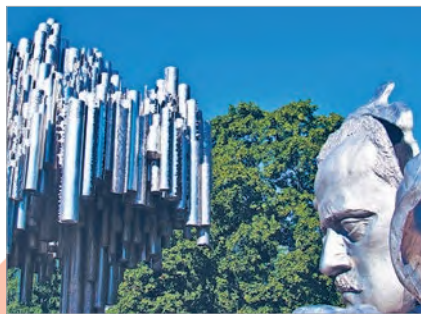
Эйла Хильтунен. Памятник Яну Сибелиусу (Хельсинки, Финляндия)

Скульптура и музыка. Пластика форм в сочетании с «музыкальностью» композиции получила воплощение в памятнике финскому композитору Яну Сибелиусу. Скульптурное произведение состоит из двух самостоятельных частей, объединённых лишь постаментом (скалой). Такой оригинальный приём позволил автору создать неповторимый художественный образ. Первая часть