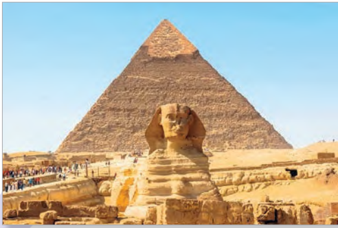
Сфінкс і піраміда Хеопса (Егіпет)