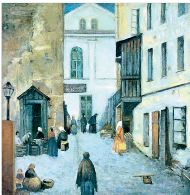
Юдаль Пэн. Вуліца ў Віцебску

На карціне «Вуліца ў Віцебску» Юдаля Пэна адкрываецца від на адзін з куткоў роднага горада беларускага мастака. Вуліца, забудаваная шматкватэрнымі дамамі, не пустэльная. Асветленая яркім сонцам, яна напоўнена жыццём. Паўсюль — людзі, занятыя штодзённымі справамі.