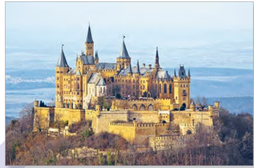
Замак Гагенцблерн (Германія)

З першабытных часоў чалавек імкнуўся ўпрыгожваць месца, у якім жыў. Так, на сценах і скляпеннях пячор захаваліся сляды чалавечых далоняў, хвалістыя лініі, геаметрычныя фігуры, выявы жывёл. Менавіта ў тыя далёкія часы і нараджалася мастацтва.