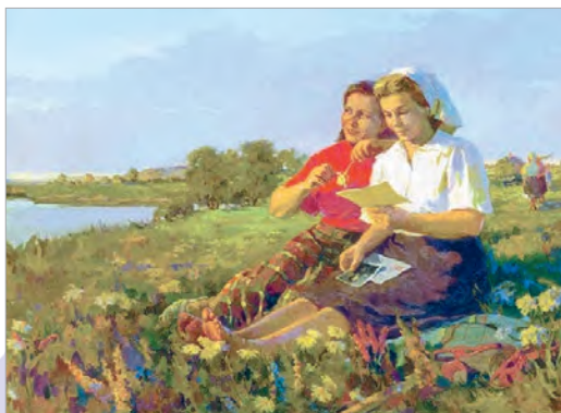
Раіса Кудрэвіч. Сяброўкі

Яркія, сакавітыя фарбы лета перадаюць радасны настрой дзвюх дзяўчат на карціне «Сяброўкі» беларускай мастачкі Раісы