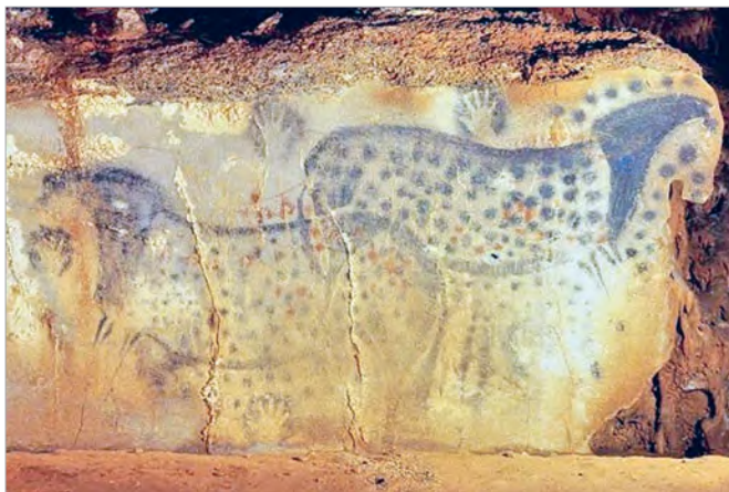
Наскальны малюнак з пячоры Пеш-Мерль (Францыя)

Навукоўцы з усяго свету — мастацтвазнаўцы, археолагі, гісторыкі — выказваюць мноства здагадак і тэорый пра першаасновы мастацтва. Але ўсе яны падобныя ў адным. Мастацтва з'явілася тады, калі чалавек пачаў усведамляць прыгажосць свету і імкнуцца прыўнесці яе ў сваё жыццё.