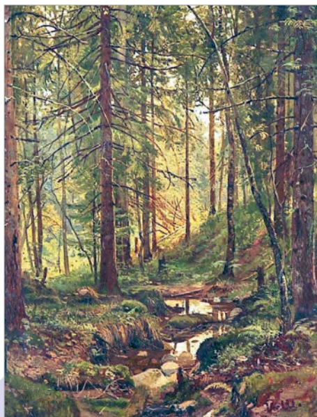
Іван Шышкін. Ручай у лесе (На касагоры)

На карціне «Мадонна са шчыглом» італьянскі мастак Рафаэль стварыў вобраз ласкавай клапатлівай маці, якая з любоўю назірае за тым, як дзіця Іаан Хрысціцель перадае Хрысту птушаня. Вобраз