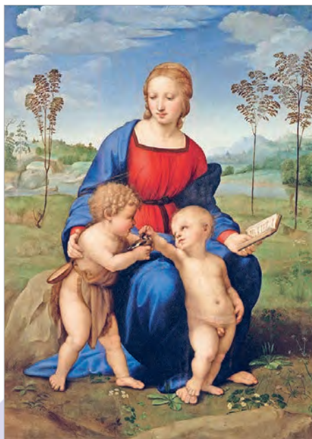
Рафаэль. Мадонна са шчыглом