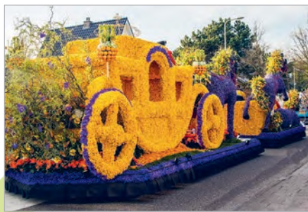
Фестываль кветак (Нідэрланды)

тварожная пасха азначаюць новае жыццё. На першым плане размешчана фарфоровая фігурка ягняці як адзін з сімвалаў Ісуса Хрыста. Папяровыя кветкі на святочнай ежы сімвалізуюць Багародзіцу. У пузатым імбрычку адбіваецца акно, праз якое быццам даносіцца звон, нагадваючы людзям пра чысціню веры.