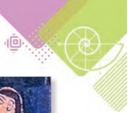
Фрагмент штандара (старажытны горад Ур, Месапатамія)