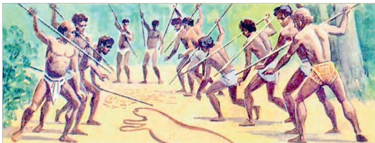
Абрад перад паляваннем

Святы — урачыстыя дні, вызначаныя для шанавання якой-небудзь падзеі, важнай для асобнага чалавека, сям'і ці цэлага народа.