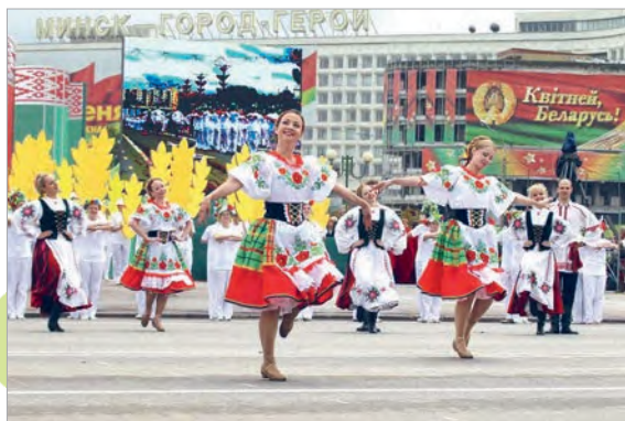
Святочнае шэсце ў Дзень Незалежнасці (г. Мінск, Беларусь)

Дзяржаўныя святы. У большасці краін свету ёсць асаблівыя святы — дзяржаўныя. У гэтыя дні адзначаюць гадавіны найважнейшых падзей у гісторыі краіны. Дзяржаўныя святы — сімвал яднання