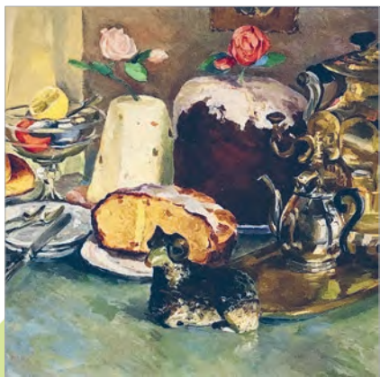
Аркадзій Пластаў. Велікодны нацюрморт (фрагмент)

Рэлігійныя свята. У культуры розных краін і народаў асобнае месца займаюць рэлігійныя свята. У царкоўным календары хрысціян адным з галоўных свят з'яўляецца Вялікдзень.