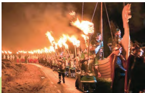
Свята агню ў Шатландыі