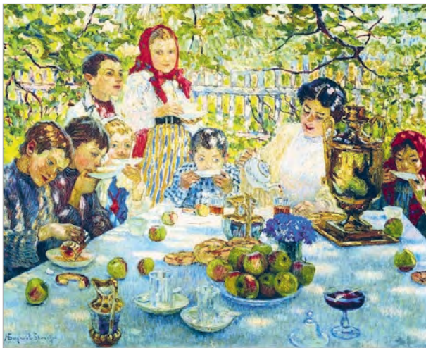
Мікалаі Багданаў-Бельскі. Імяніны настаўніцы

Сямейныя свята. У розных кутках планеты людзі святкуюць найважнейшыя падзеі, звязаныя з жыццём іх сем'яў, — нараджэнне, паўналецце, заканчэнне вучобы, вяселле, юбілей... Гэта сямейныя свята. У кожнай краіне існуюць свае традыцыі святкавання такіх падзей. Многія важныя для сваякоў урачыстасці суправаджаюцца сямейна-бытавымі абрадамі. Абрадавыя дзеянні маюць характар таінства і здзяйснююцца сярод родных і блізкіх. І няхай у кожнай мясцовасці, у кожнай сям'і ў святкаванні дадаюць нешта сваё, адно застаецца нязменным: музыка, танцы, смех і добры настрой спадарожнічаюць усім сямейным святам. Жадаючы па-асабліваму адзначыць сямейную падзею, людзі ўпрыгожваюць жылло, рыхтуюць пачастункі. З надзеяй і радасцю чакаюць сяброў і блізкіх, прапануюць ім цікавыя забавы і падарункі.