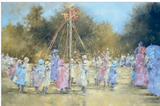
Пітэр Мілер. Майскае дрэва

язычніцкіх кultaў дрэў, якія лічыліся сімваламі ўрадлівасці і ўладкавання свету, мастамі паміж людзьмі і багамі.