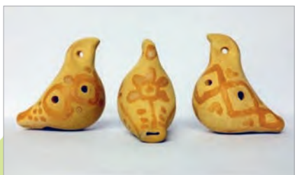
Цацка-свістулька ў форме птушкі