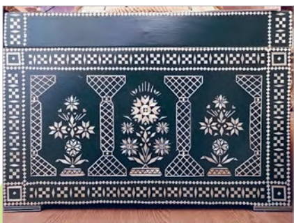
Вікторыя Гармаза́. Родныя мясціны Беларусі (апликацыя саломкай на куфры)

асаблівых урачыстасцей, калі нашы продкі пры дапамозе абрадаў і рытуалаў імкнуліся заручыцца падтрымкай звышнатуральных сіл.