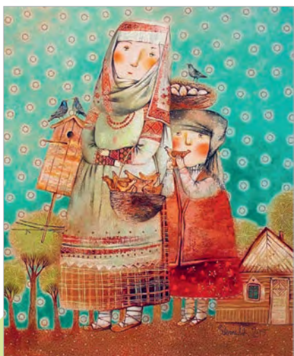
Ганна Сілівончык. Шпакі прыляцелі