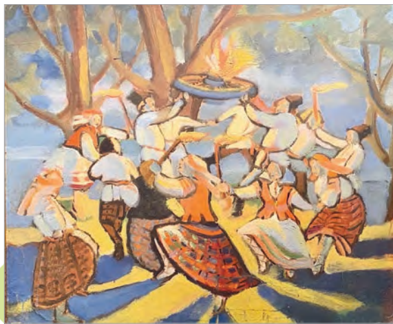
Міхаіл Філіповіч. На Купалле

Існаваў звычай на Купалле пускаць па рацэ вянкi, сплеченыя з красак. Вянкi плялі дзяўчаты напярэдадні святкавання. Славяне верылі, што гэтай ноччу адбываюцца цуды. Лічылася, што тая дзяўчына, чый вянок прыстане да берага, абавязкова сёлета выйдзе замуж.