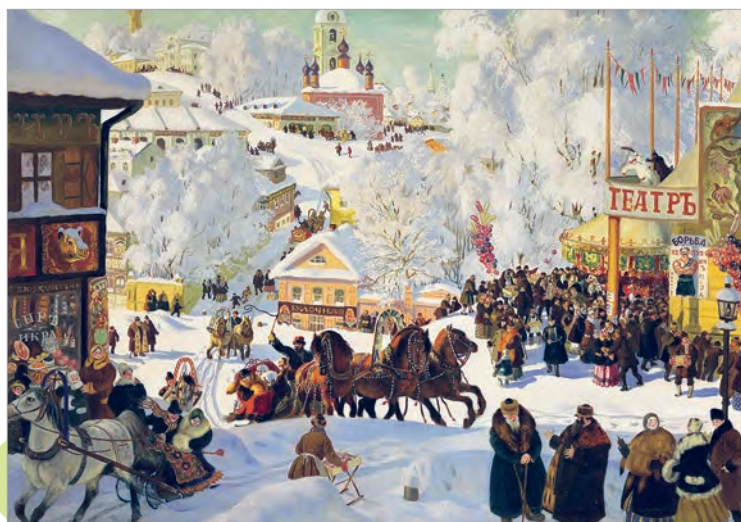
Барыс Кустодзіеў. Масленіца

На карціне «Масленіца» рускі мастак Барыс Кустодзіеў перадаў атмасферу карнавалу, якая пануе на гуляннях. Яркія фарбы напаўняюць звонкай музыкай казачны гарадскі пейзаж. Зямля, дрэвы, дахі дамоў яшчэ накрыты шчыльным снежным футрам, але людзі