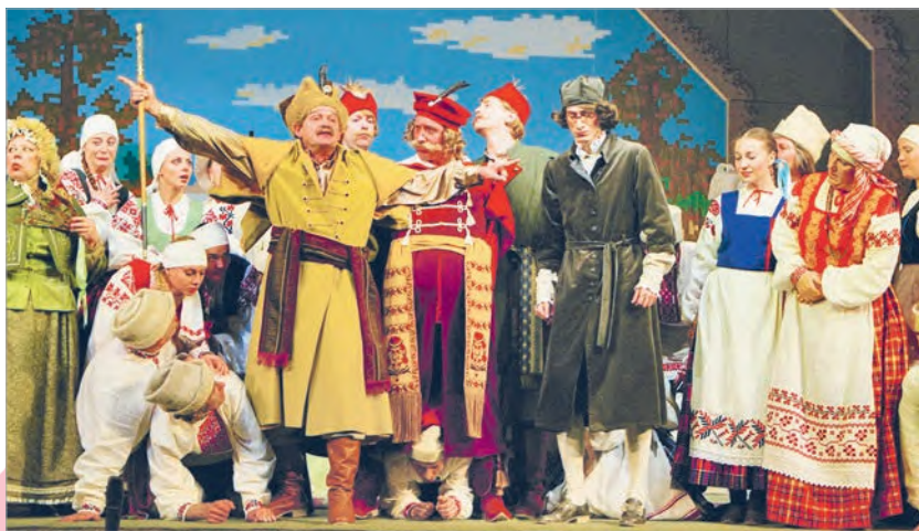
Сцэна са спектакля «Несцерка». Нацыянальны акадэмічны драматычны тэатр імя Якуба Коласа (г. Віцебск, Беларусь)

Дзеянне — чарада падзей, заснаваных на сутыкненні інтарэсаў.