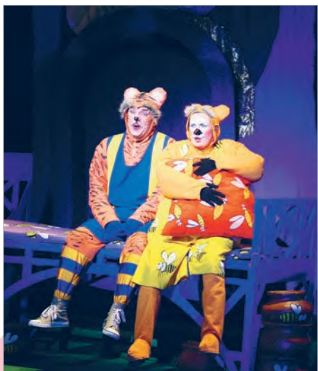
Сцэна са спектакля «Віні-Пух і ўсе-ўсе-ўсе...». Нацыянальны акадэмічны Вялікі тэатр оперы і балета Рэспублікі Беларусь (г. Мінск)

Светлая палітра спектакля. Для атрымання разнастайных сцэнічных эфектаў сцэна абсталявана спецыяльнымі асвятляльнымі прыборамі — разнастайнымі