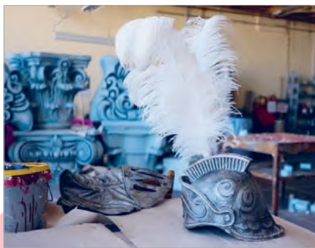
У бутафорскім цэху. Беларускі дзяржаўны акадэмічны музычны тэатр

Макёт — паменшаная ў шмат разоў выява сцэнічнай прасторы.