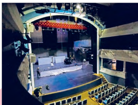
Сцэна-каробка. Нацыянальны акадэмічны тэатр імя Янкі Купалы (г. Мінск, Беларусь)

Партэр — з фр. «на зямлі». Ніжні паверх глядзельнай залы.