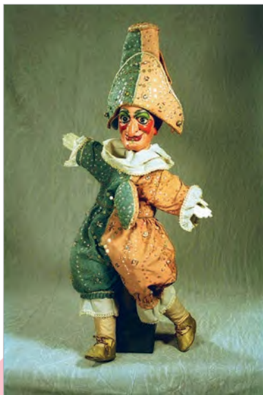
Лялька Палішынель (Францыя)

У розных краінах былі свае любімцы — героі лялечных прадстаўленняў. Пульчы-нела — у Італіі, Палішынель — у Францыі, Пятрушка — у Расіі. Гэтыя героі не толькі смяшылі і весялілі гледачоў, але і перамагалі ворагаў, каралі зло і сцвярджалі справядлівасць. Да таго ж яны не былі ідэальныя — сваволілі і гарэзнічалі. А калі ўлічыць, што ў межах прадстаўленняў персанажы часцяком паведамлялі самыя свежыя навіны, вулічныя лялечныя спектаклі можна назваць своеасаблівымі «жывымі сайтамі навін».