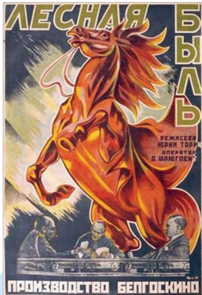
Афіша фільма «Лясная быль» (рэжысёр Юрый Тарыч)

Мастацкае кіно — адзін з самых папулярных відаў мастацтва. Сёння мастацкае кіно часта называюць гульнявым — ад слова «гульня».