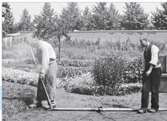
Кадр з фільма «Паліты палівальшчык» (рэжысёры Луі і Агюст Люм'ер)

На кінапаказе братаў Люм'ер пабываў вядомы ілюзіяніст Жорж Мельес. Фільмы здаліся яму сумнымі і аднастайнымі. Таму ён звярнуў увагу на забаўляльны бок кіно — трукі і спецэфекты. У фантастычнай стужцы «Падарожжа на Месяц» ён выкарыстаў новыя