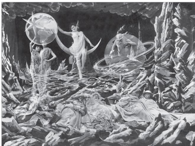
Кадр з фільма «Падарожжа на Месяц» (рэжысёр Жорж Мельєс)