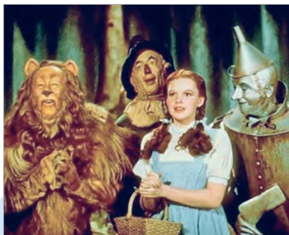
Кадр з фільма «Чараўнік краіны Оз» (рэжысёр Віктар Флэмінг)

прыёмы — стоп-кадр, запаволеную здымку. У сучасным кіно гэтыя эфекты звыклія. Але многія рэжысёры вучыліся і дагэтуль вучацца ў Жоржа Мельєса, менавіта ім прыдуманя эфекты выкарыстоўваюць у сваіх фільмах.