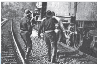
Кадр з фільма «Вялікае рабаванне цягніка» (рэжысёр Эдвін Пóртэр)