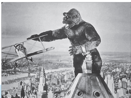
Кадр з фільма «Кінг-Конг» (1933, рэжысёр Мэрыян Купер)