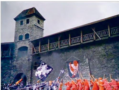
Кадры з фільма «Горад майстроў» (рэжысёр Уладзімір Бычкоў)

падказваюць глядачу асаблівасці ўзаемаадносін герояў — прыгажуні Веранікі і герцага дэ Малікорна. Арыгінальны грым акцёра, які выконвае ролю герцага, дае яшчэ адну падказку. Ён падкрэслівае каварны характар персанажа. Закаханы ў Вераніку герцаг змятае на сваім шляху ўсе перашкоды, кожны дзень прыдумляючы новыя спосабы, як заваяваць яе сэрца.