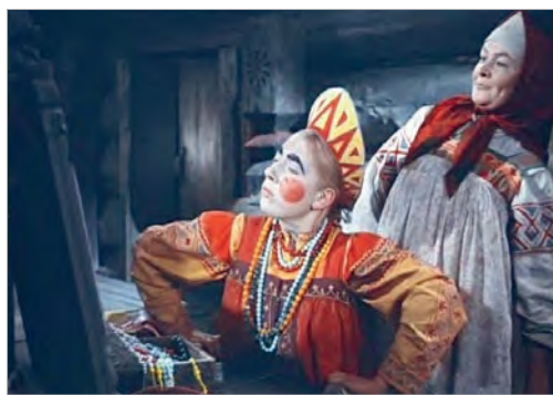
Кадры з фільма «Марозка» (рэжысёр Аляксандр Роу)