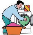
lavar la ropa