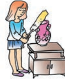
limpiar el polvo