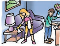
arreglar la habitación