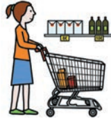
hacer la compra