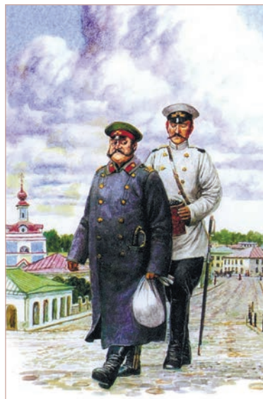
Ил. А. Л. Дудина

— Гм!.. Хорошо... — говорит Очумелов строго, кашляя и шевеля бровями. Хорошо... Чья собака? Я этого так не оставлю. Я покажу вам, как собак распускать! Пора обратить