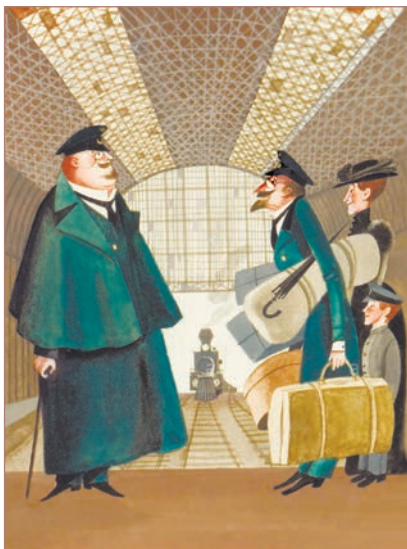
Ил. С. А. Алимова

— Я, ваше превосходительство... Очень приятно-с! Друг, можно сказать, детства и вдруг вышли в такие вельможи-с! Хи-хи-с.