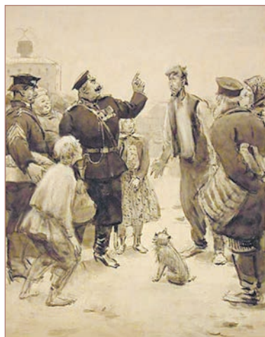
С. В. Герасимов. На базарной площади

— Да разве братец ихний приехали? Владимир Иваныч? — спрашивает Очумелов, и всё лицо его заливается улыбкой умиления. — Ишь ты, господи! А я и не знал! Погостить приехали?