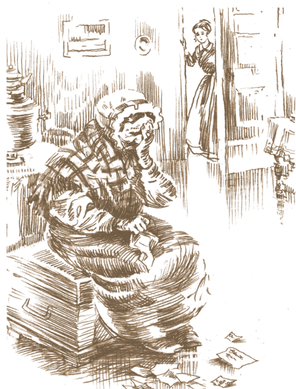
Ил. Н. Панина

Когда подле матушки заменила её гувернантка, она получила ключи от кладовой, и ей на руки сданы были бельё и вся провизия. Новые обязанности эти она исполняла с тем же усердием и любовью. Она вся жила в барском добре, во всём видела трату, порчу, расхищение и всеми средствами старалась противодействовать.