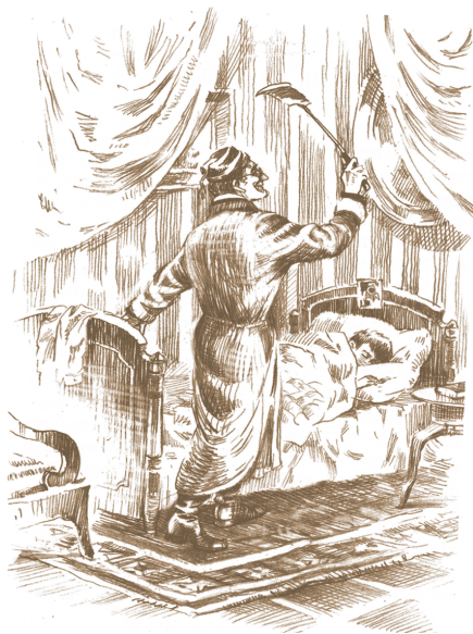
Ил. Н. Панина

12-го августа 18..., ровно в третий день после дня моего рождения, в который мне минуло десять лет и в который я получил такие чудесные подарки, в семь часов утра Карл Иваныч разбудил меня, ударив над самой моей головой хлопущкой — из сахарной бумаги на палке — по мухе. Он сделал это так неловко, что задел образец моего ангела, висевший на дубовой спинке кровати, и что убитая муха упала мне прямо на голову. Я высунул нос из-под одеяла, остановил рукою образец, который продолжал качаться, скинул убитую муху на пол и хотя заспанными, но сердитыми глазами окинул Карла Иваныча. Он же, в пёстром ваточном халате, подпоясанном поясом из той же материи, в красной вязаной ермолке с кисточкой и в мягких козловых сапогах, продолжал ходить около стен, прицеливаться и хлопать.