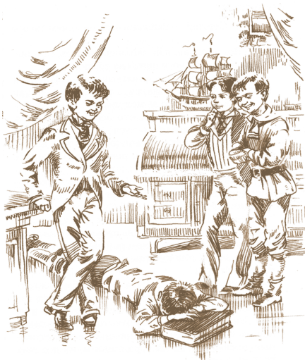
Ил. Н. Панина

Я не сообразил того, что бедняжка плакал, верно, не столько от физической боли, сколько от той мысли, что пять мальчиков, которые, может быть, нравились ему, без всякой причины, все согласились ненавидеть и гнать его.