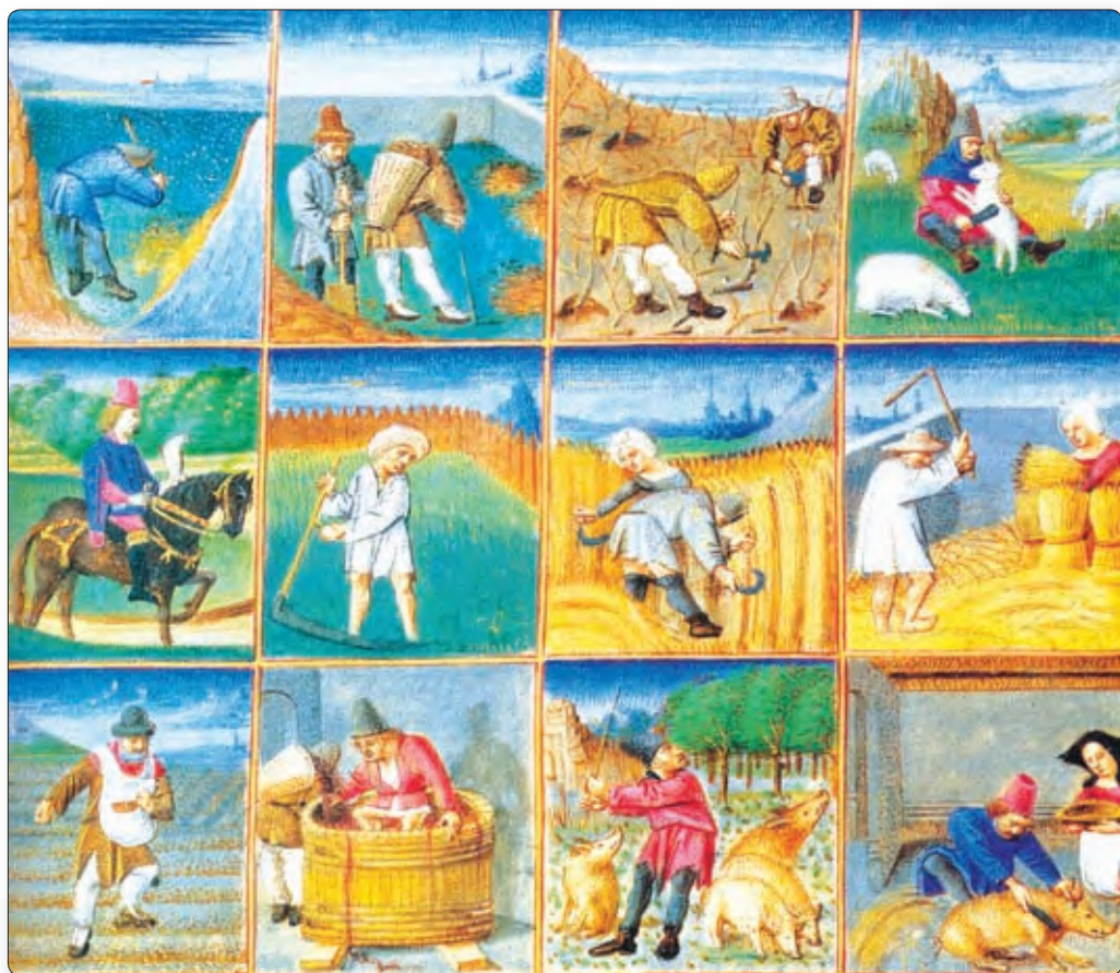
▲ Павіннасці сялян на карысць феадала. Сярэднявечная мініяцюра

гэта панскія палі , ураджай з якіх ішоў непасрэдна ў свёрны феадала. Меншая частка — сялянскія надзелы , ураджай з якіх атрымлівалі сяляне. За карыстанне надзеламі сяляне выконвалі для феадалаў розныя работы. Гэтыя прымусовыя абавязкі называліся павіннасцямі .