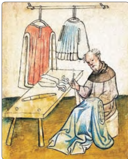
▲ Кравец. Сярэднявечная мініяцюра