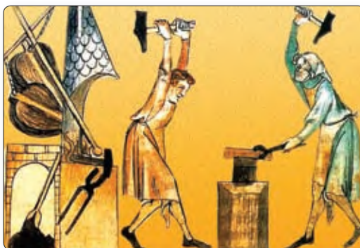
▲ Кавалі. Сярэднявечная мініяцюра