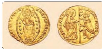
▲ Залатая манета Венецыі — дукат