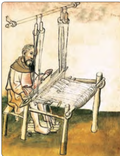
▲ Ткач. Сярэднявечная мініяцюра

нападу на горад усе члены цэха складалі атрад апалчэння. Пад цэховым сцягам яны выступалі на абарону горада. Як правіла, члены цэха сяліліся на адной вуліцы, якую так і называлі: вуліца Пекараў, Ткачоў, Краўцоў, Кавалёў, Збройнікаў.