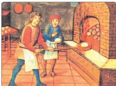
▲ Пекары. Сярэднявечная мініяцюра

Існавала правіла: калі беглы селянін пражывае ў горадзе год і адзін дзень, ён становіцца свабодным і выходзіць з-пад улады феадала. Таму і казалі: «Гарадское паветра робіць чалавека вольным».