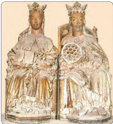
▲ Атон I з жонкай. Сярэднявечная скульптура