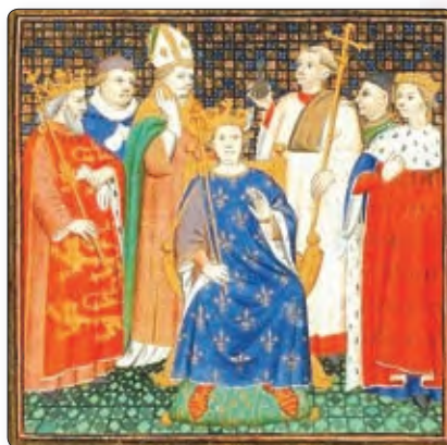
Каранацыя Філіпа II Аўгуста. ▶ Сярэднявечная мініяцюра

Французскім каралям прыйшлося адваёўваць гэтыя ўладанні Плантагенетаў . У пачатку XIII ст. кароль Філіп II Аўгуст пашырыў свае ўладанні амаль у чатыры разы. Пад уладай англічан заставалася толькі невялікая частка французскіх зямель. І паступова адбывалася аб'яднанне ўсёй